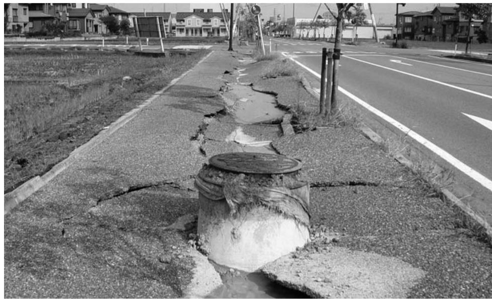
Contrada Ciocco - Contrada Talci, San Michele

Doganella-Via Ninfina (Comuni di Sermoneta e Cisterna). Dallo studio effettuato emergono vari indizi di pericolosità geologica. Colpita da un recente sprofondamento, questa zona è imposta su un'area tettonica che per lungo tempo è stata sede di fenomeni sorgivi idrotermali che hanno dato luogo a una serie di depositi travertinosi. Uno studio geofisico eseguito per il Comune di Cisterna, ubicato a nord della Via Ninfina, ha individuato travertini e depositi terrogeni, nonché una depressione dai margini scoscesi, colmata di sedimenti rimaneggiati (parliamo di Sinkhole?).