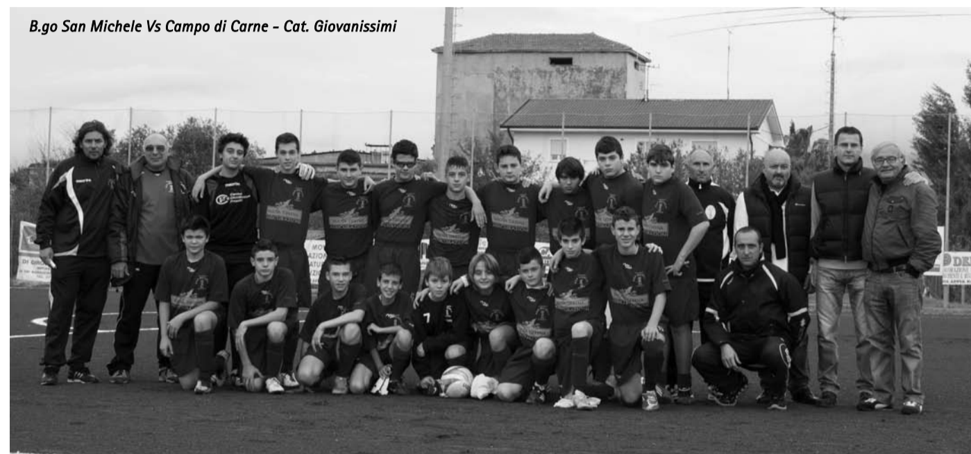
B.go San Michele Vs Campo di Carne - Cat. Giovanissimi