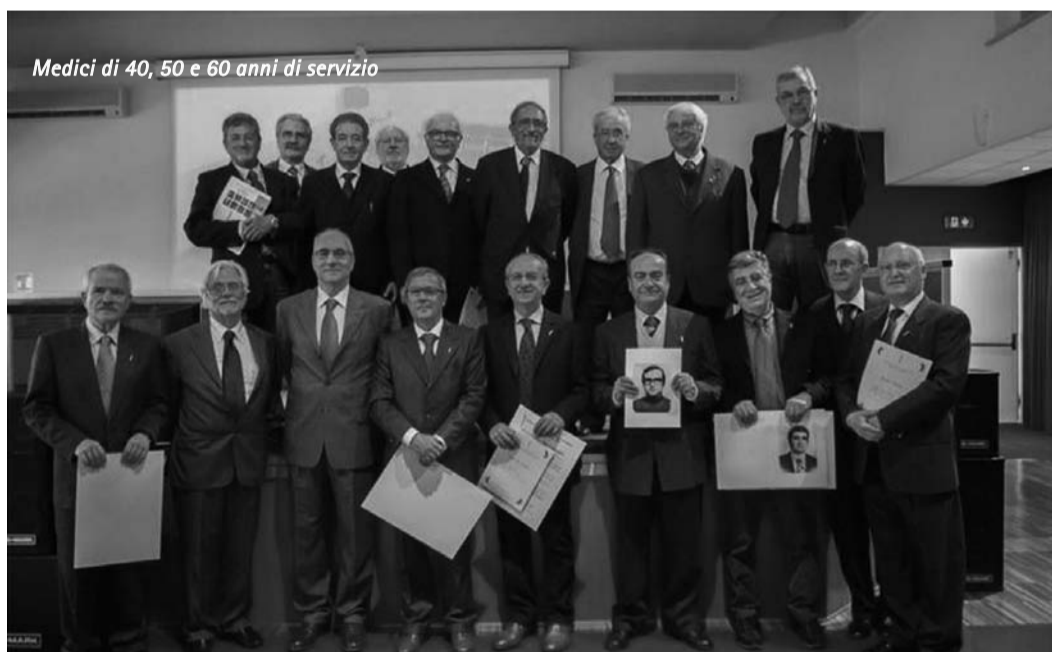
Medici di 40, 50 e 60 anni di servizio

cina, offrirà assistenza diurna ad una famiglia di Latina, che in casa ospita, un familiare in stato vegetativo. Il costante collegamento con un call center fornirà un'assistenza costante, collegandosi con gli specialisti, pronti ad intervenire in telemedicina. La manifestazione, di sabato 16 marzo, sarà trasmessa in diretta streaming, dalle 9.30, sul sito www.ordinemedicilatina.it e prevede la consegna del Bastone di Esculapio, simbolo della professione per i giovani medici, che s'impegnano a salvaguardare la salute dei cittadini.