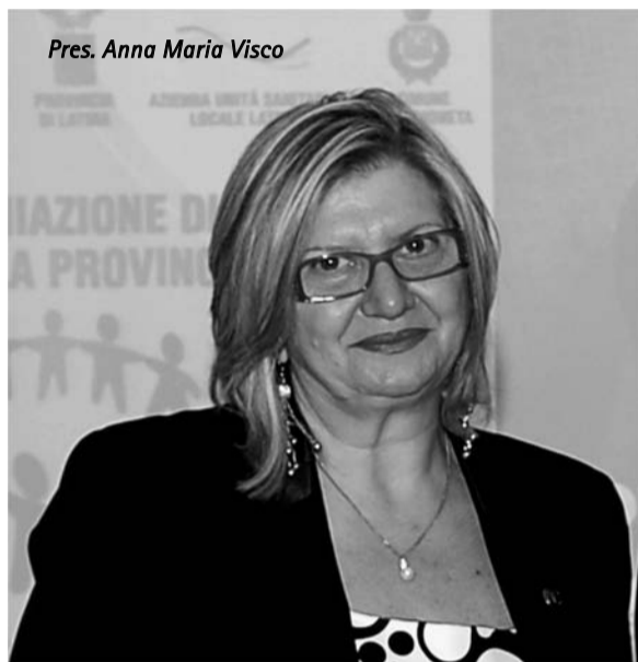
Pres. Anna Maria Visco

rispetto ad una singola donazione di sangue intero. Inoltre, si può donare più frequentemente rispetto ad una donazione di sangue intero e cosa da non sottovalutare si possono congelare i singoli componenti e poi utilizzarli al bisogno. Il nostro obiettivo è di realizzare un centro di congelamento che possa poi servire da "banca" in caso di emergenza, abbiamo anche individuato la location e richiesto alla regione di promuovere la nostra richiesta che speriamo sia accolta al più presto.